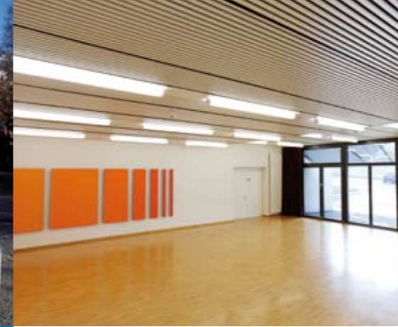
«Einhornsaal» im Erdgeschoss

Das alteingesessene Zuger Geschlecht war im Hochmittelalter während der Freiheitskämpfe der Eidgenossen mächtig und einflussreich. Davon zeugt noch heute die Hünenberger Burgruine. Nach der Sage soll Heinrich, ein Spross der Familie und ein berühmter Schütze, den Eidgenossen vor der Schlacht bei Morgarten (1315) mit einem Pfeilschuss aus der Armbrust die legendäre Botschaft «Hütet euch am Morgarten» übermittelt haben.