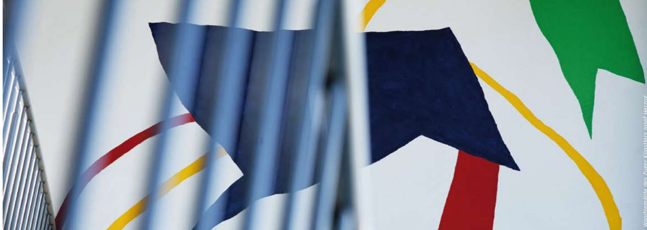
Wandgemälde des Zuger Künstlers Josef Herzog