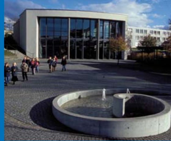
Dorfplatz mit Brunnen